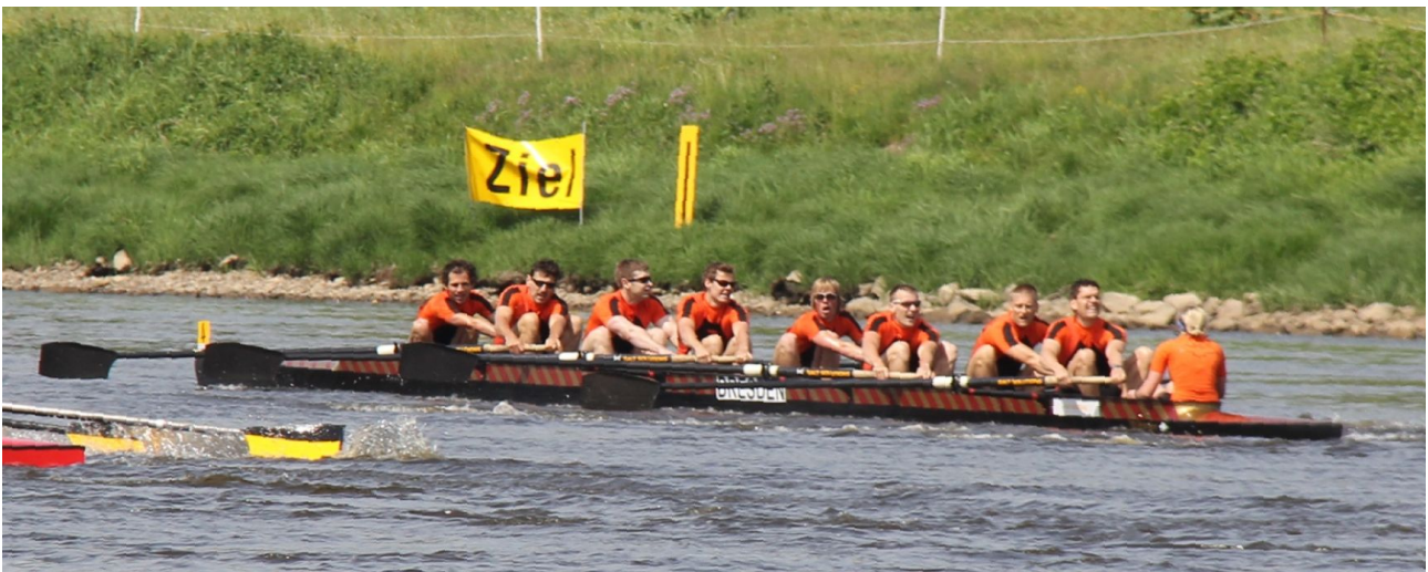
Bild: Der Dresdner Fledermausachter am vergangenen Sonntag im Rennen auf der Elbe – hier noch mit dem alten Boot.

Dresden 27.5.2011: Die Bundesligamannschaft des Dresdner Fledermausachters (Universitätssportverein TU Dresden / Pirnaer RV 1872) startet mit einem neuen Boot in die Saison 2011. Die "neue Fledermaus" legt nach ihrer Taufe am Sonntag um 15 Uhr vom Blasewitzer Bootshaus aus zu ihrer Jungfernfahrt auf der Elbe ab.